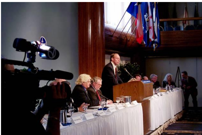
Fra pressekonferansen 9. mai 2001.