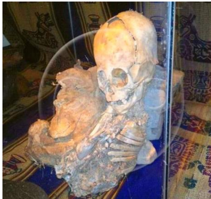
Mumien som ble funnet i Peru, 2011.

Greer hadde kommet langt bedre fra det dersom han i stedet hadde rettet oppmerksomheten mot funnet i 2011 i Peru av et mumifisert skjelett av et humanoid barn, som definitivt ikke var Homo sapiens [se min artikkel ET-mumie funnet i Peru ( Nyhetspeilet , 2011)]. Men da hadde ikke Greer fått stå i sentrum av begivenhetene.