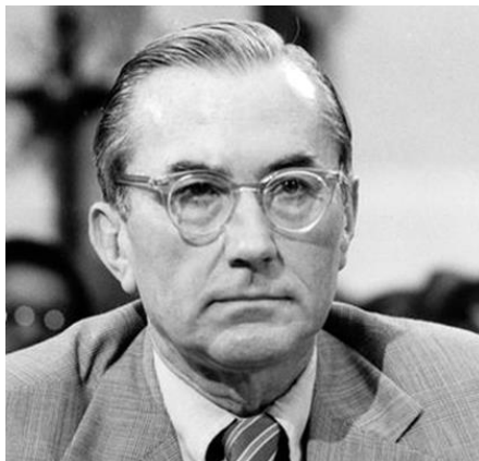
William Colby (1920-1996)