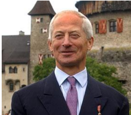
Prins av Liechtenstein Hans-Adam II. En raus melkeku?