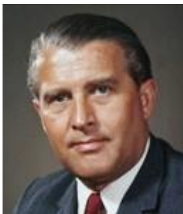
Wernher von Braun