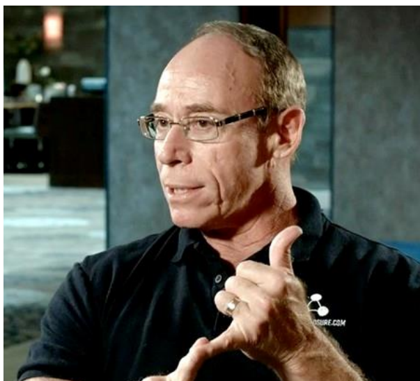
Fra et foredrag i Los Angeles 2007.